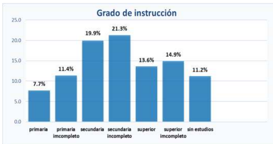
Figura 2. Gráfica porcentual de grado de instrucción de los informantes

En la tabla 7, se presenta la distribución de grado de instrucción de los informantes, en la cual se observa que el 21.3% del total de informantes tienen “secundaria incompleto”, 19.9% tienen un grado de instrucción “secundaria”, 14.9% “superior incompleto”, 13.6% “superior”, 11.4% “primaria incompleta”, 11.2% “sin estudios”, y el 7.7% “primaria”. De lo observado se concluye que la mayoría de los contribuyentes del impuesto predial tienen “secundaria incompleta” dentro del distrito.