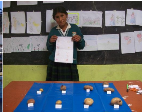
I.E “San Juan Bautista” de Shilla. Exposición de los estudiantes del 6to