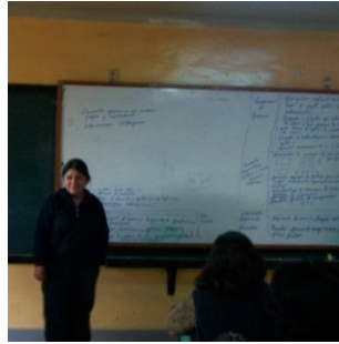
Coordinando con los padres de familia para el trabajo de elaboración del calendario